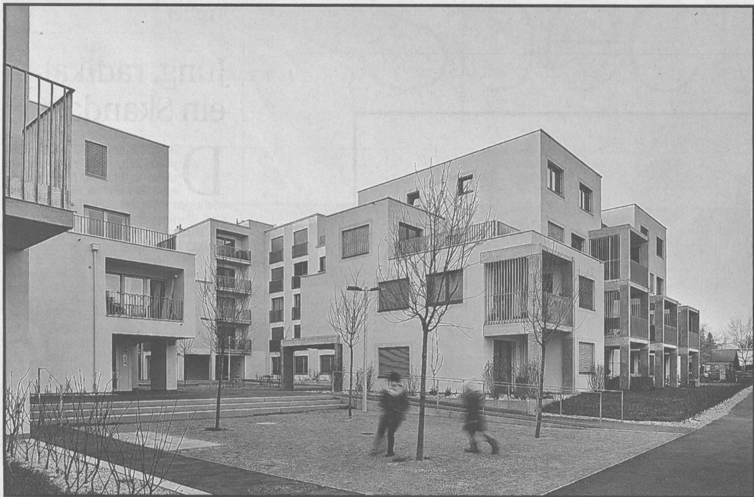
Wie in einer Weinviertler Hintaus-Gasse: die Siedlung MGG22 in der Stadlauer Mühlgrundgasse. Auf drei Grundstücken finden sich ...